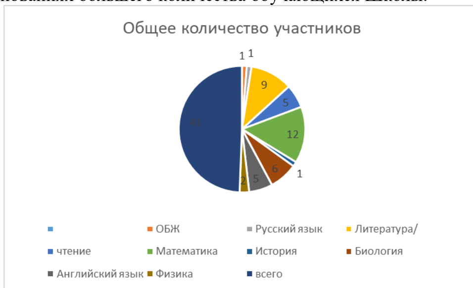
Диаграмма 2. Диаграмма участия школьников во ВсОШ

В 2023 году был проанализирован объем участников конкурсных мероприятий разных уровней. Дистанционные формы работы с учащимися, создание условий для проявления их познавательной активности позволили принимать активное участие в дистанционных конкурсах муниципальных, регионального уровней. Результат – положительная динамика участия в олимпиадах и конкурсах, привлечение к участию в интеллектуальных соревнованиях большего количества обучающихся Школы.