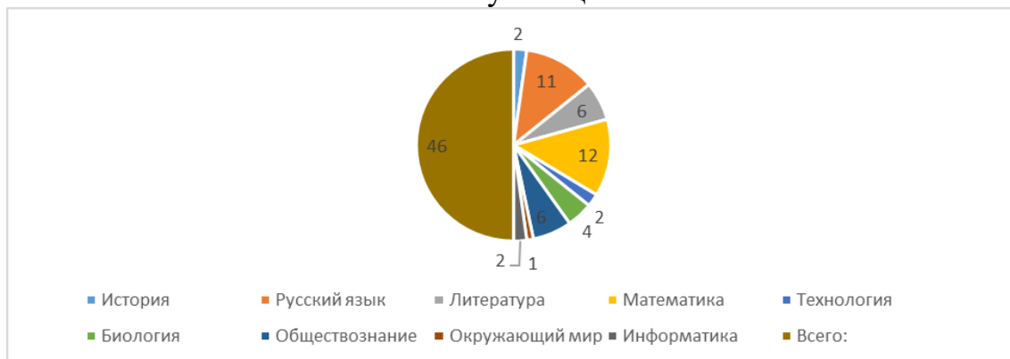
Диаграмма 2. Диаграмма участия школьников во ВсОШ

В 2022 году был проанализирован объем участников конкурсных мероприятий разных уровней. Дистанционные формы работы с учащимися, создание условий для проявления их познавательной активности позволили принимать активное участие в дистанционных конкурсах муниципальных, регионального уровней. Результат – положительная динамика участия в олимпиадах и конкурсах, привлечение к участию в интеллектуальных соревнованиях большего количества обучающихся Школы.